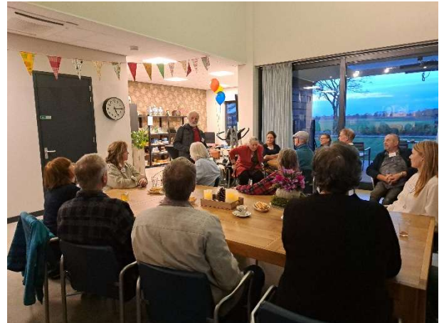
Muzikantenbijeenkomst november 2025

De muzikanten kunnen jaarlijks ook (evt. anoniem) feedback geven via de enquête.